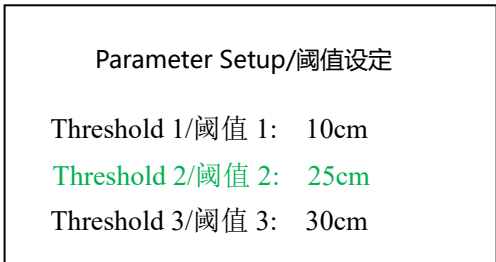
图 2. LCD 显示界面参考图 2（阈值设置界面）

B1 按键：“设置”按键，按下后进入阈值设定界面（如图 2 所示），再次按下 B1 按键时退出设置界面，保存用户设定的结果到 E2PROM，并返回图 1 所示的液位检测界面。